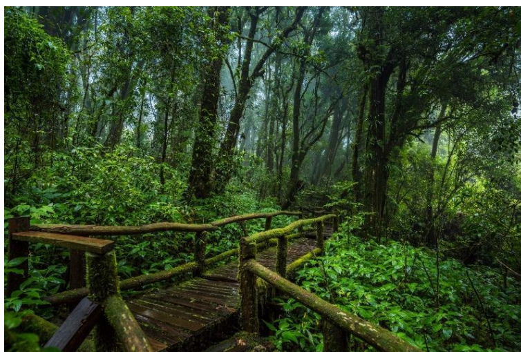
อุทยานแห่งชาติดอยหลวง