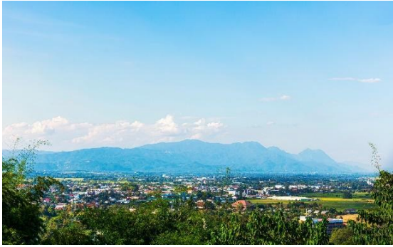
อุทยานแห่งชาติถ้ำหลวง – ขุนน้ำนางนอน