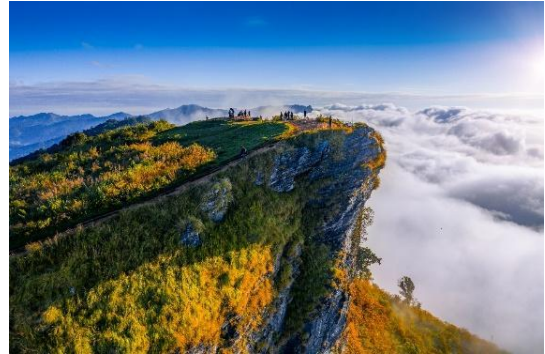
อุทยานแห่งชาติภูชี้ฟ้า