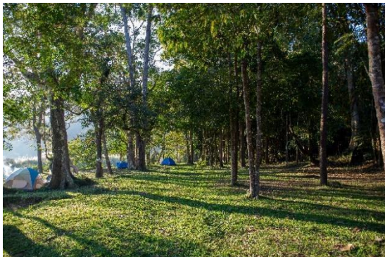
อุทยานแห่งชาติลำน้ำกก